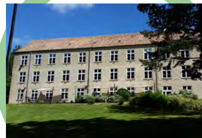
Sødisebakke Bygning C