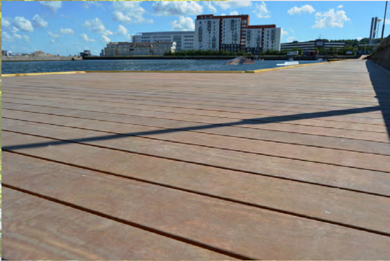
Trædæk Østre Havn Aalborg