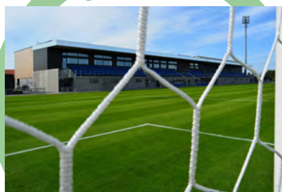
Femhøje Stadion Hjørring