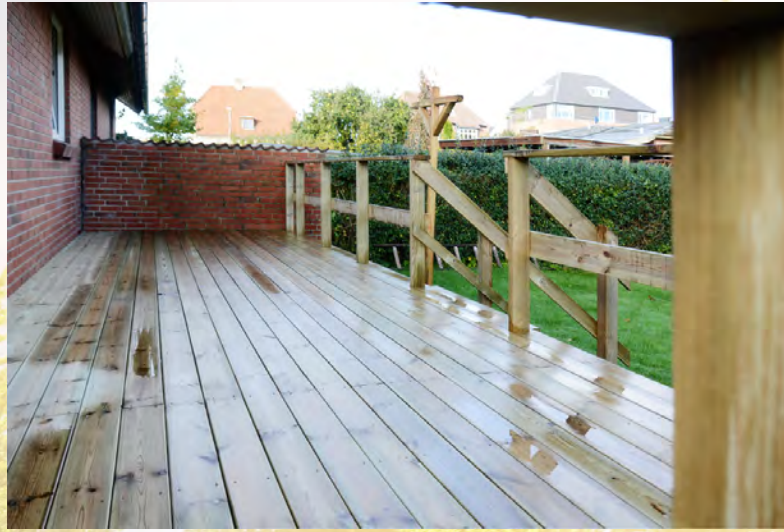
Terrasse ved villa Aalborg