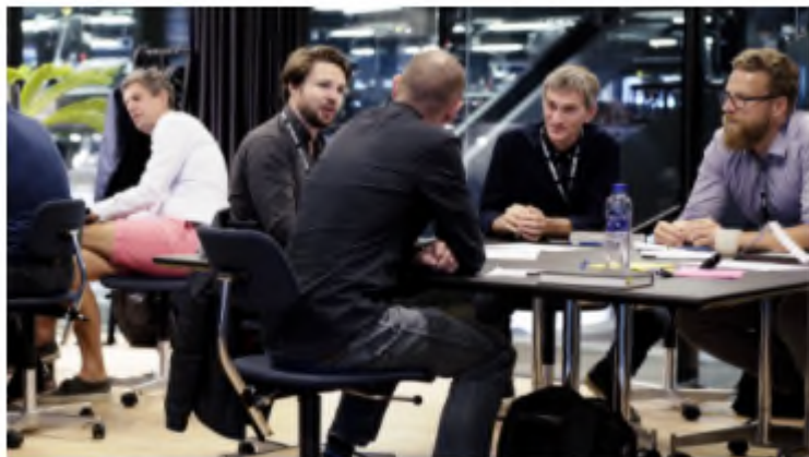
NYHED Projekt ConTech – teknologi i byggeriet