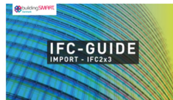
NY IFC-GUIDE buildingSMART Danmark udgiver guide i import af IFC-filer