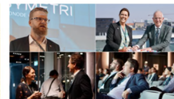
BUILDINGSMART NORDIC CONFERENCE 2020 Nordisk konference synliggør gevinsterne ved openBIM